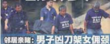
邻居亲睹：男子凶刀架女佣颈